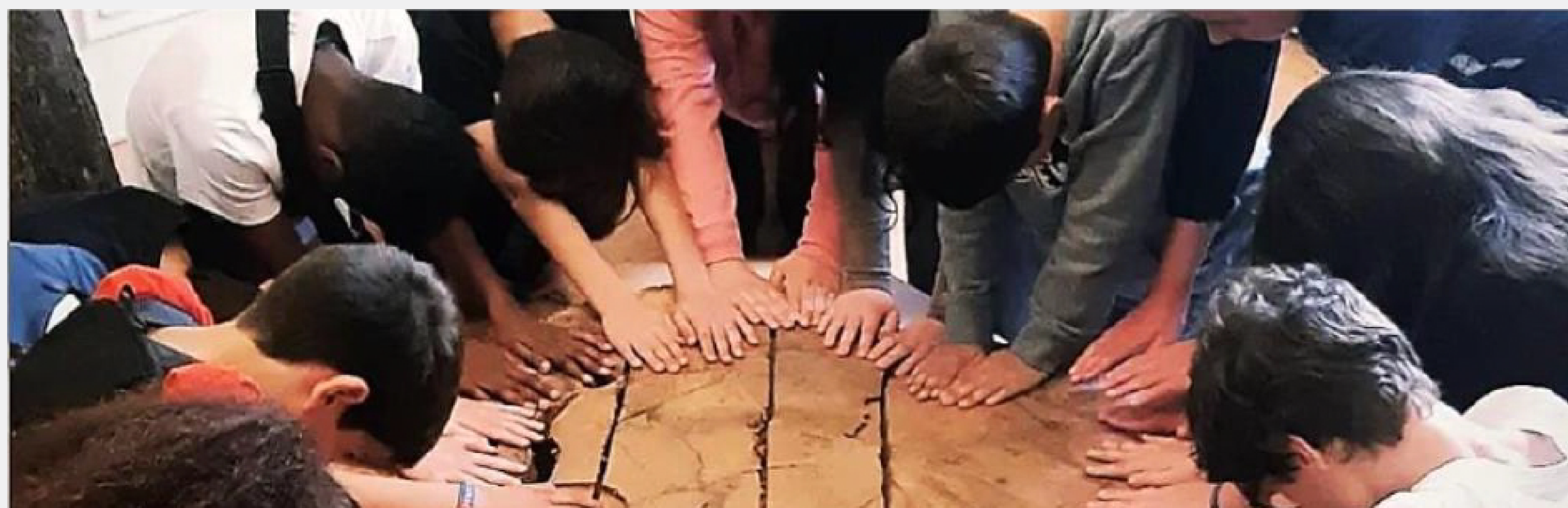
Figura2: Alunos do nível básico realizando a experiência de sentir o tronco de sobreiro de mais de 200 anos.

Relativamente ao nível de ensino, o espaço foi visitado maioritariamente por alunos do ensino básico, dos 6 aos 15 anos (Figura2).